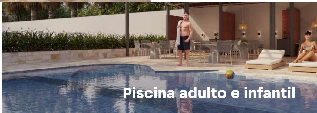
Piscina adulto e infantil