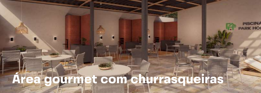
Área gourmet com churrasqueiras